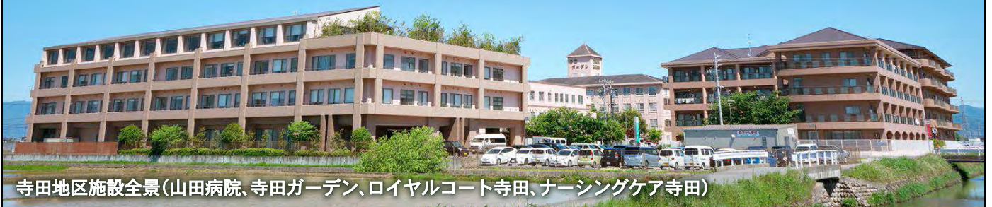
寺田地区施設全景(山田病院、寺田ガーデン、ロイヤルコート寺田、ナーシングケア寺田)